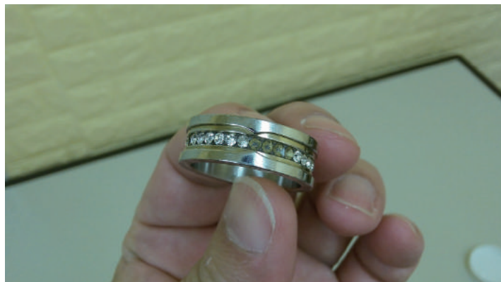
● くすんだ指輪の表面が…