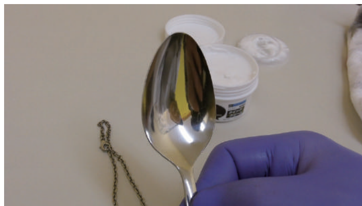
● 顔が映るほどピカピカに！

●用途外に使わないで下さい。●乳幼児の手の届くところに置かないで下さい。●人体には使用しないで下さい。●直射日光を避け高温になるところには置かないで下さい。●使用後は必ずフタをして下さい。●周囲に飛散しないよう注意して下さい。●必ず保護手袋をして下さい。●肌に触れる装飾品を磨く場合はアレルギー反応に注意し、よく水洗いをしてからご着用下さい。●食器・カトラリー等、口にするものの場合もよく中性洗剤で洗ってからご使用下さい。●ご使用前に素地を痛めないか確認し、磨き過ぎにご注意下さい。