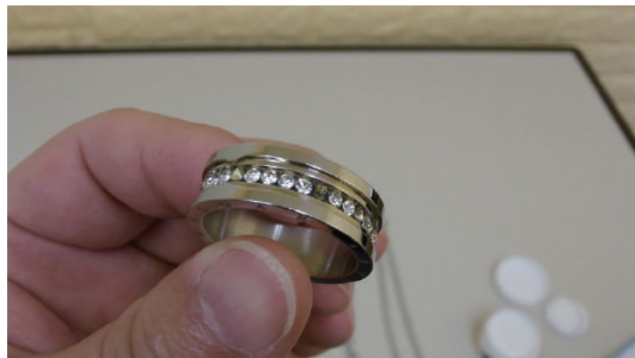
● 新品同様の輝きに！