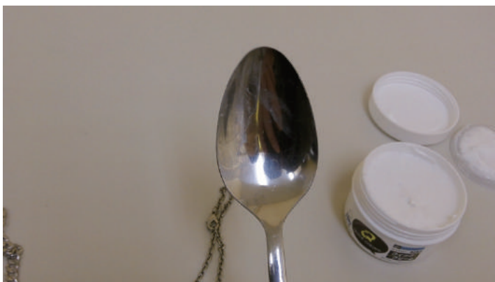
● 使い込んだスプーンも…